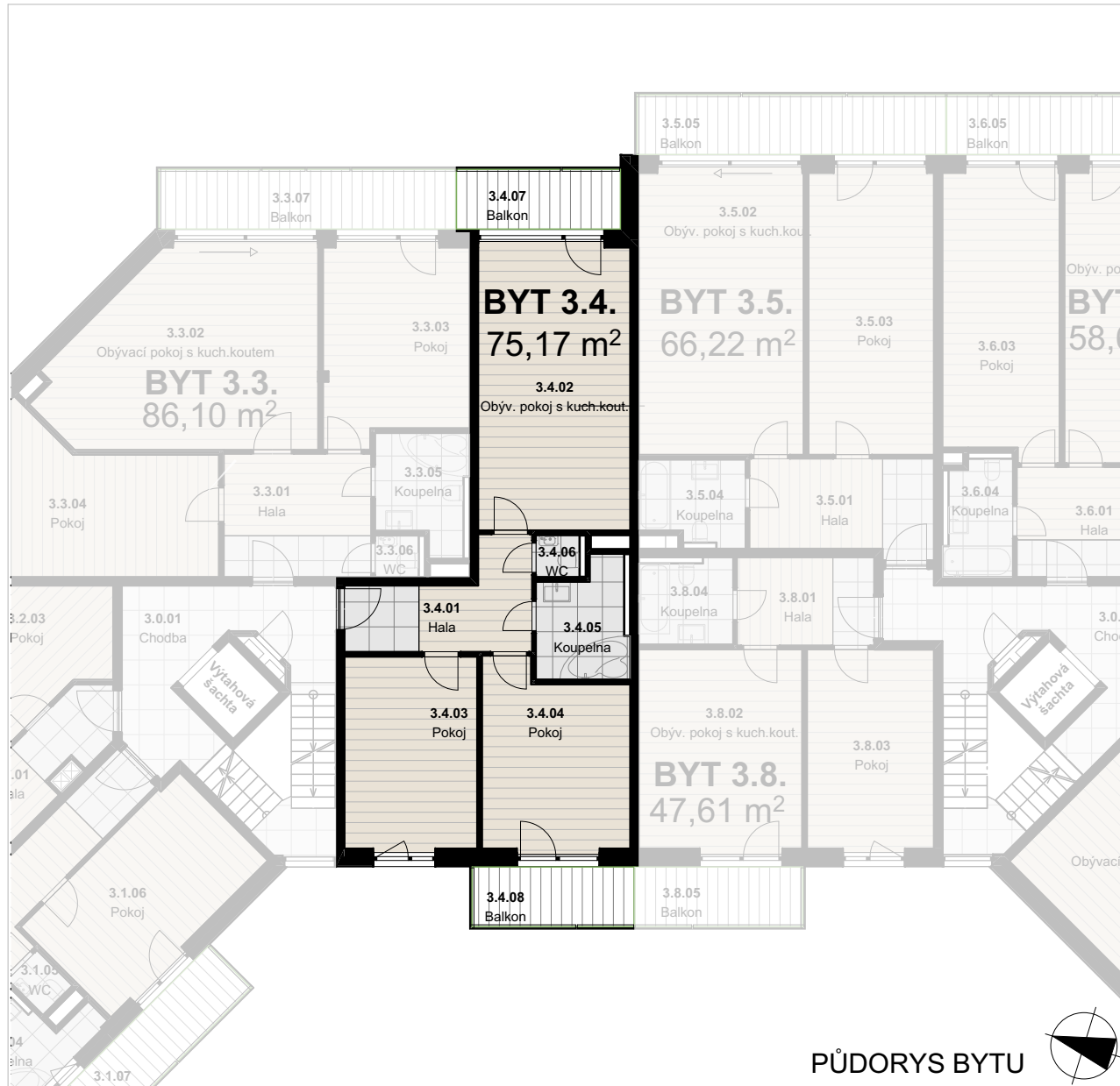
SITUACE - POLOHA BYTU