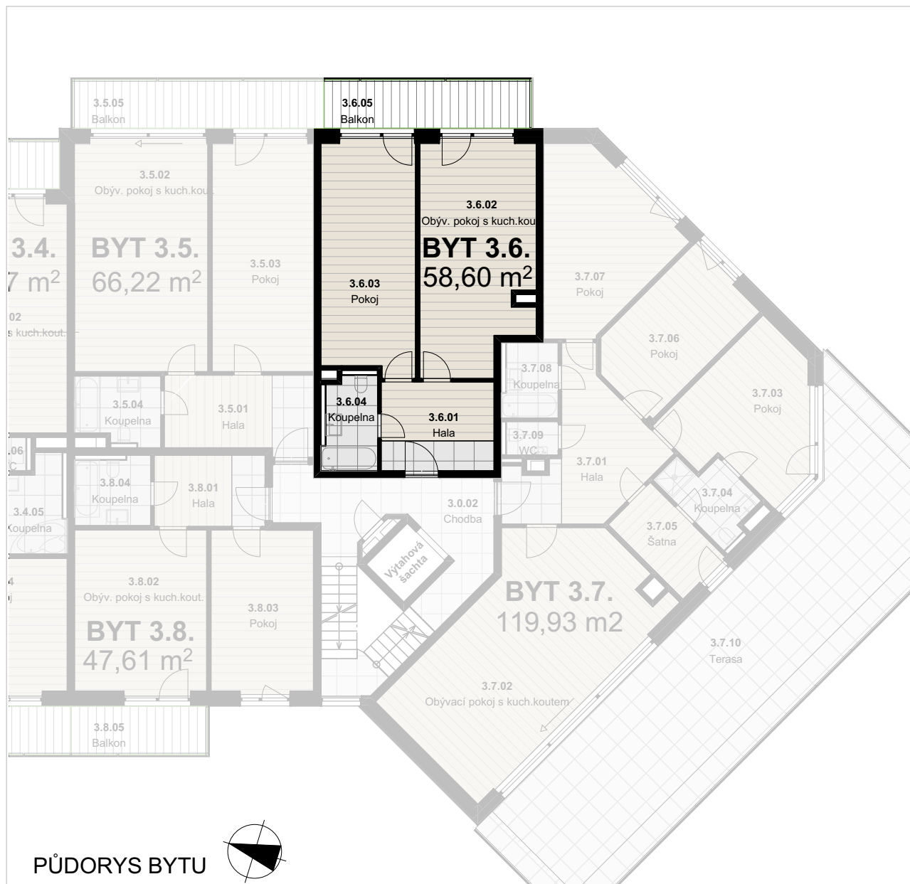
SITUACE - POLOHA BYTU